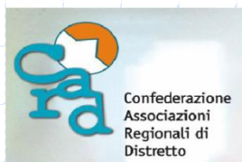
Illustrazione dei contenuti e prospettive future